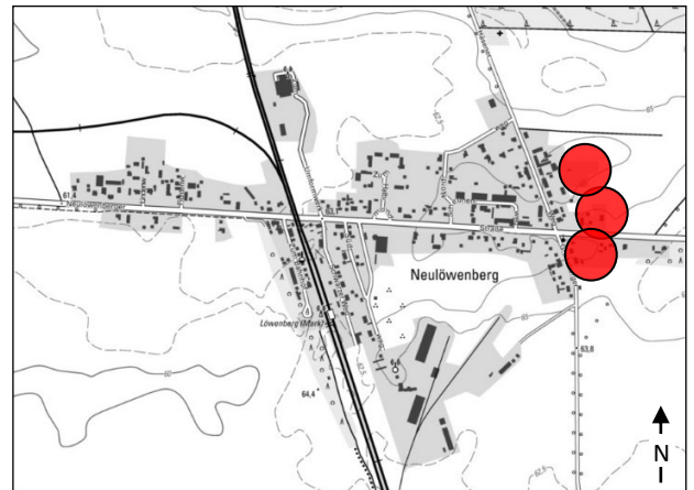
Lage im Stadtgebiet