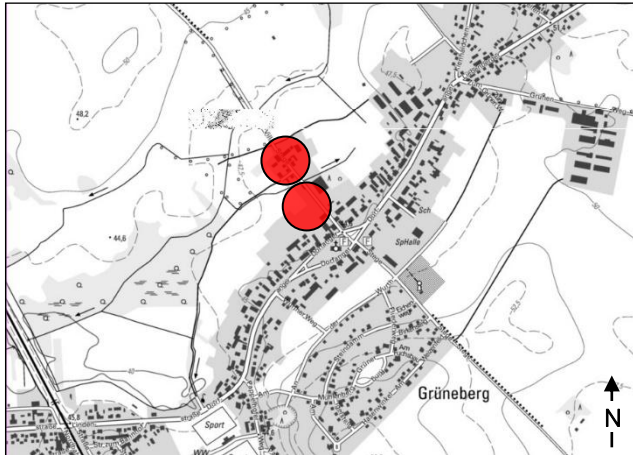
Lage im Ortsteil