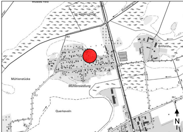
Lage im Ortsteil