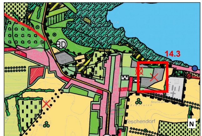
Landschaftsplan 2001, Entwicklungskarte