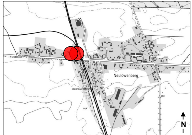
Lage im Stadtgebiet