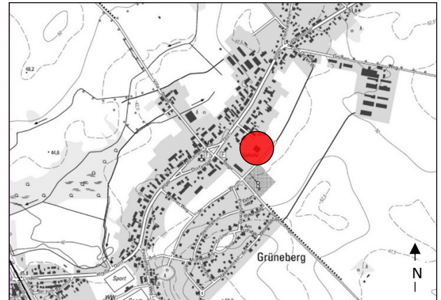
Lage im Stadtgebiet