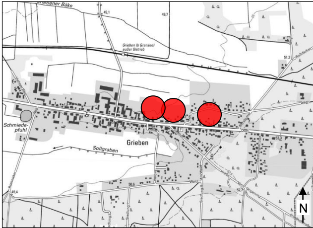
Lage im Ortsteil