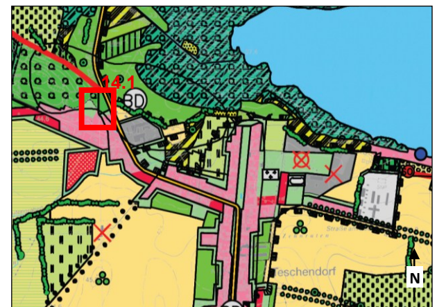
Landschaftsplan 2001, Entwicklungskarte