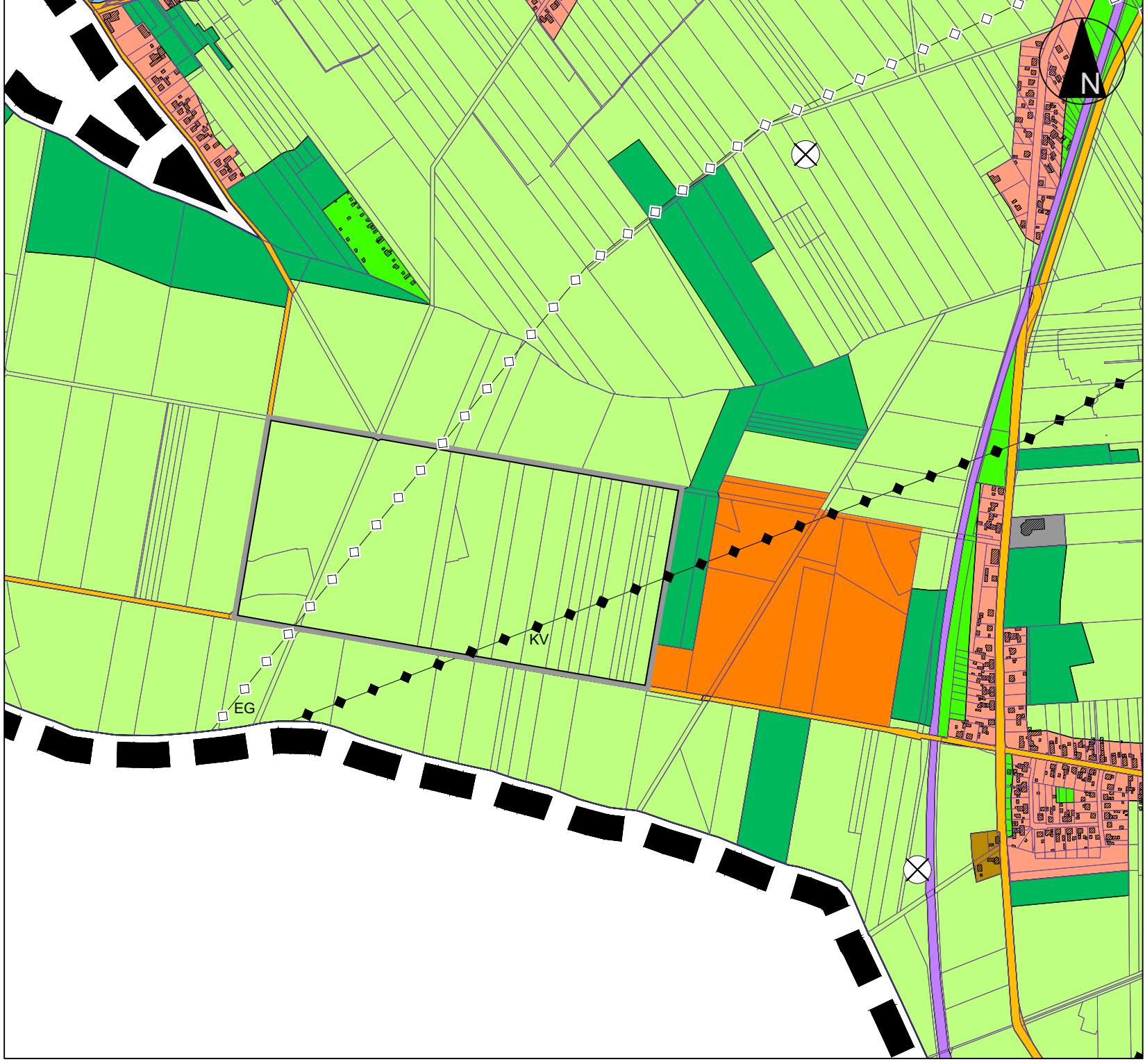
(Darstellung des Flächennutzungsplans vom 20.11.2018) Maßstab 1:10.000 (im DIN A1-Format)