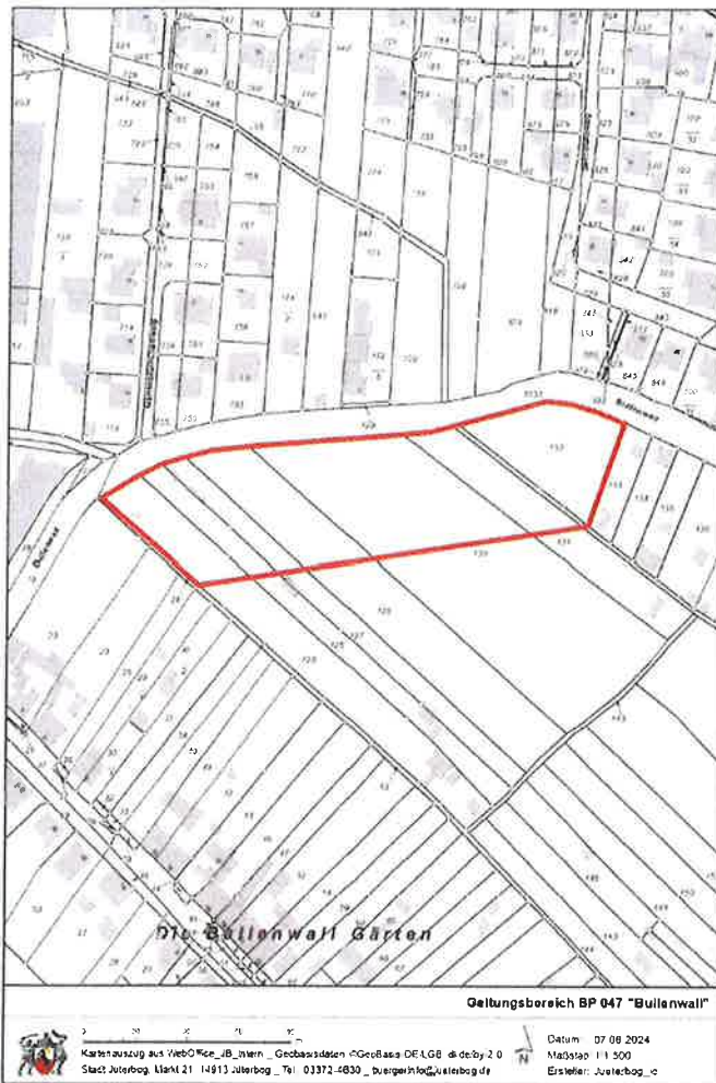
Abb.: 1: Darstellung des räumlichen Geltungsbereiches des Plangebietes