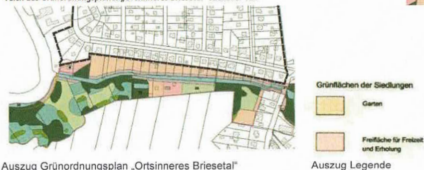
Abb. 22: Abgrenzung des Geltungsbereichs (schwarz umrandet) sowie der angrenzende Geltungsbereich des Grünordnungsplanes „Ortsinneres Briesetal“ südlicher Teil 9

Die Einbeziehung der außerhalb des Geltungsbereiches liegenden Grundstücksflächen wird für „sachgerecht“ gehalten, „da diese Fläche zwar nicht bebaut, aber als Hausgärten mit genutzt werden können“ (S. 73, 3. Absatz). Dieser Argumentation wird nicht gefolgt. Außerhalb des Geltungsbereiches gelegene Grundstücksflächen können nicht grundlegend für das Ableiten eines städtebaulichen Erfordernisses für das