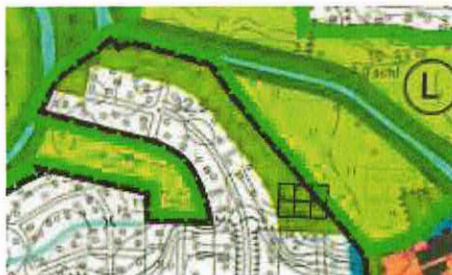
Auszug 1. Änd. FNP Abb. oben