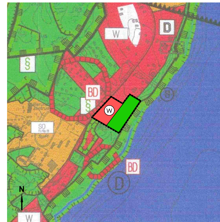
Flächennutzungsplan (Ausschnitt) in der Fassung 2006 mit Darstellung der Änderungen im Änderungsbereich © GeoBasis-DE/LGB, dl-de/by-2-0, 2006 Maßstab 1:10.000