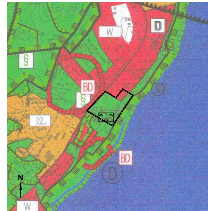
Flächennutzungsplan (Ausschnitt) in der Fassung 2006 mit Änderungsbereich Maßstab 1:10.000