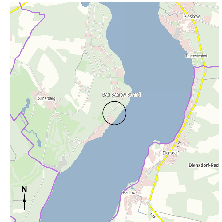
Übersichtsplan zum Flächennutzungsplan 18. Änderung mit Lage des Änderungsbereichs Maßstab 1:50.000

Flächennutzungsplan 18. Änderung Gemeinde Bad Saarow Vorentwurf Oktober 2024