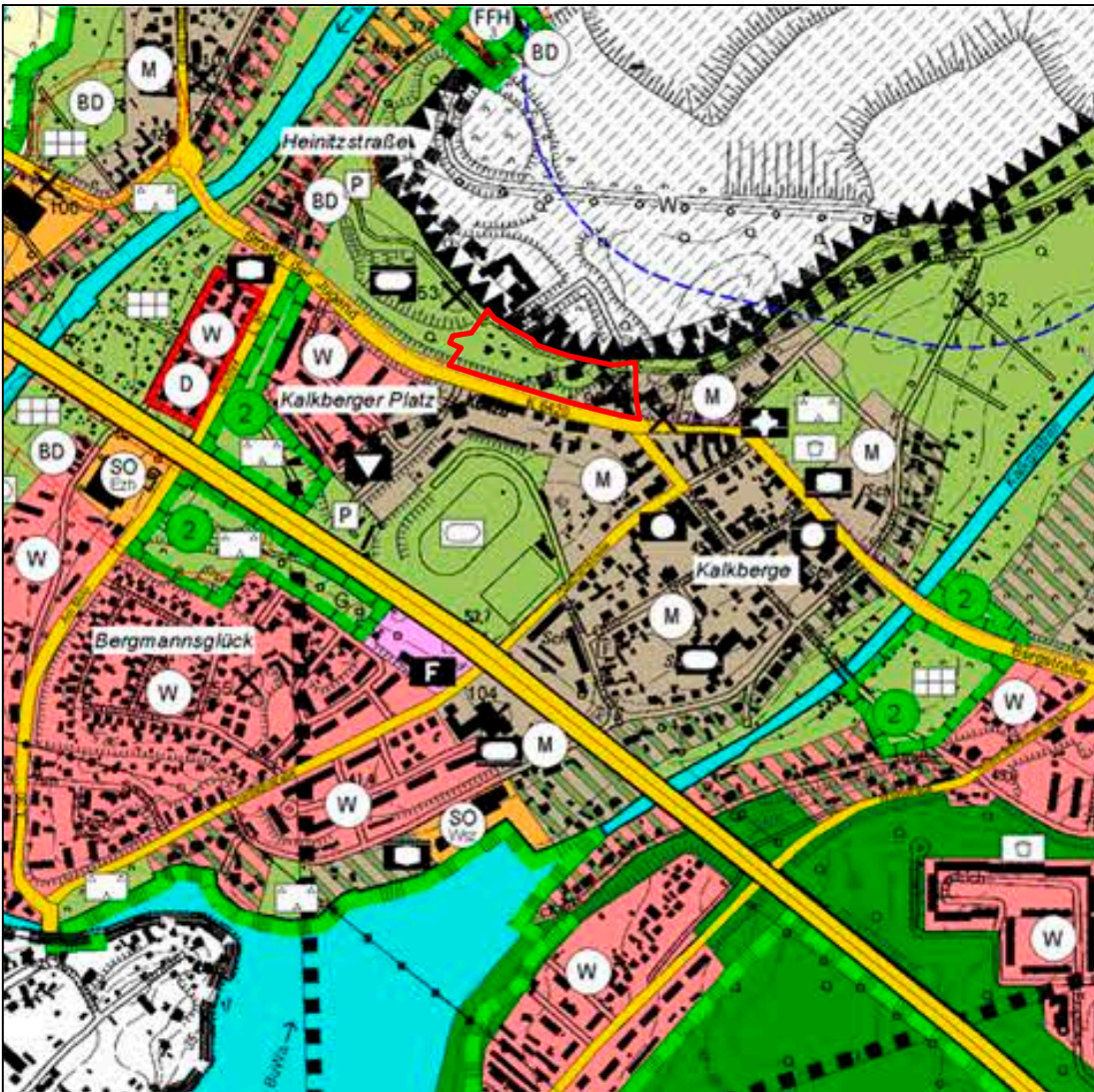
Auszug aus dem FNP Rüdersdorf bei Berlin in der Fassung vom 25. Oktober 2010, Maßstab 1:10.000 (im Originalformat), Plangrundlage: DTK 10, Geobasisdaten: GeoBasis-DE/LGB 2007, TOP 10, 3548 - NW, Genehmigungsnummer GB 226/96