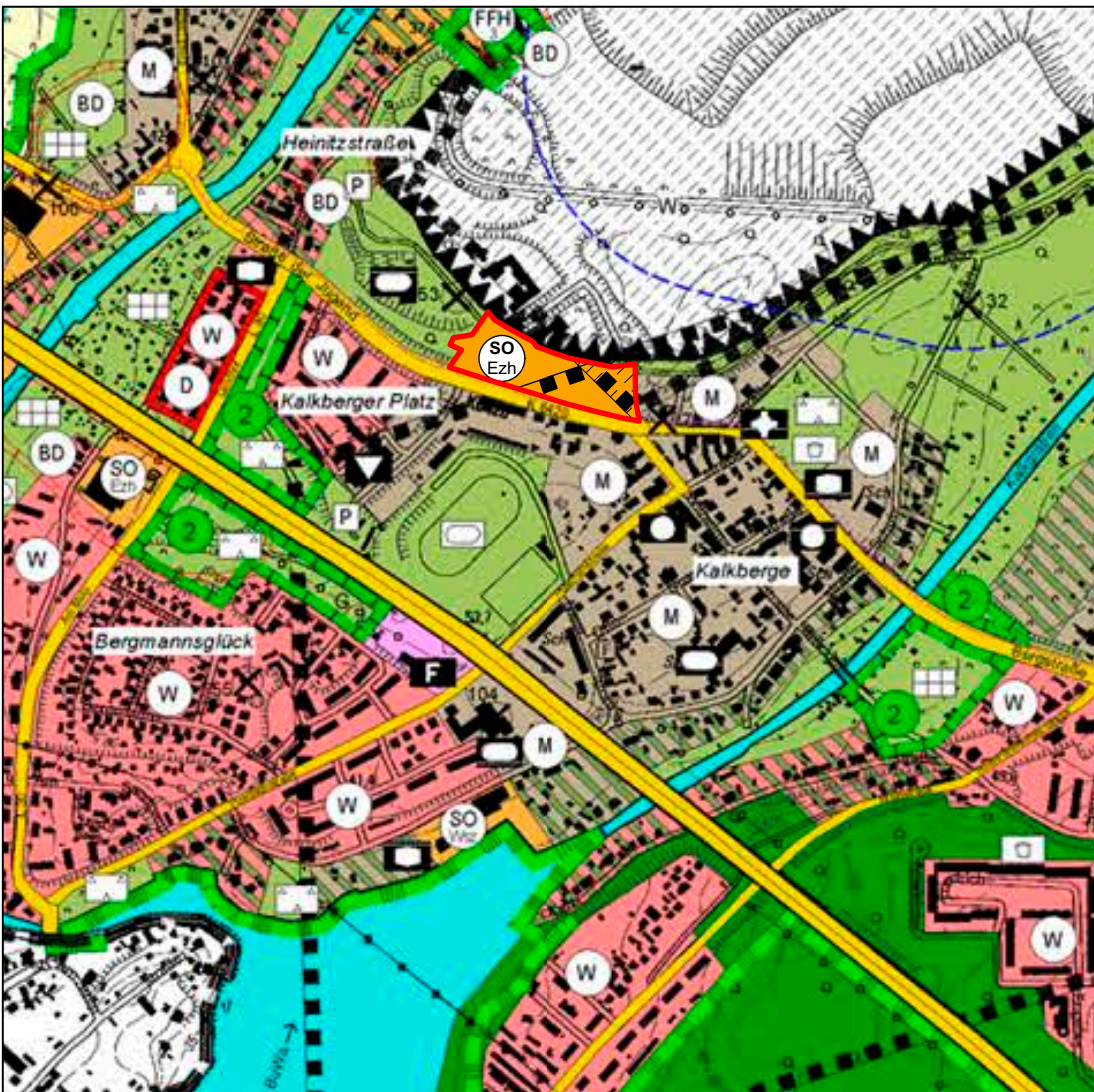
4. Änderung des FNP Rüdersdorf bei Berlin, Maßstab 1:10.000 (im Originalformat), Plangrundlage: DTK 10, Geobasisdaten: GeoBasis-DE/LGB 2007, TOP 10, 3548 - NW, Genehmigungsnummer GB 226/96

Es wird bestätigt, dass die am _____ (AZ.: - _____) seitens der höheren Verwaltungsbehörde genehmigte 4. Änderung des Flächennutzungsplans, mit dem hierzu ergangenen Feststellungsbeschluss der Gemeindevertretung vom _____ übereinstimmt.