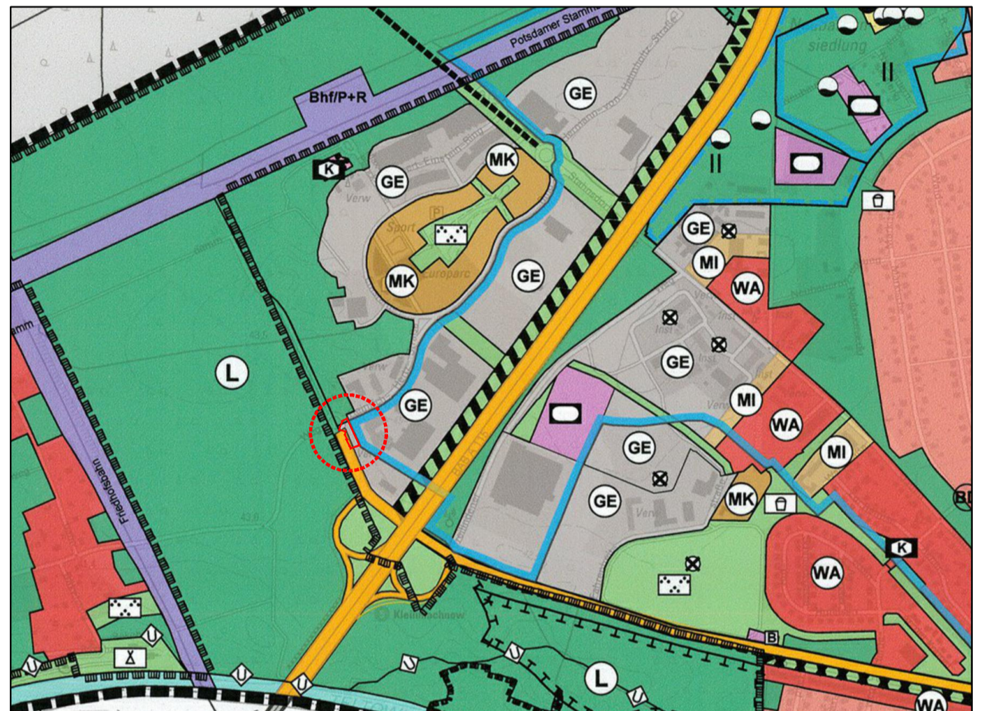
Flächennutzungsplan Kleinmachnow, M 1:10.000 Neubekanntmachung in der Fassung der 16. Änderung vom 13.07.2017 (Amtsblatt für die Gemeinde Kleinmachnow Nr. 01/2019 vom 18.01.2019)

Brandenburgische Bauordnung (BbgBO) in der Fassung der Bekanntmachung vom 15. November 2018 (GVBl.I/18, [Nr. 39]), zuletzt geändert durch Gesetz vom 28. September 2023 (GVBl.I/23, [Nr. 18])