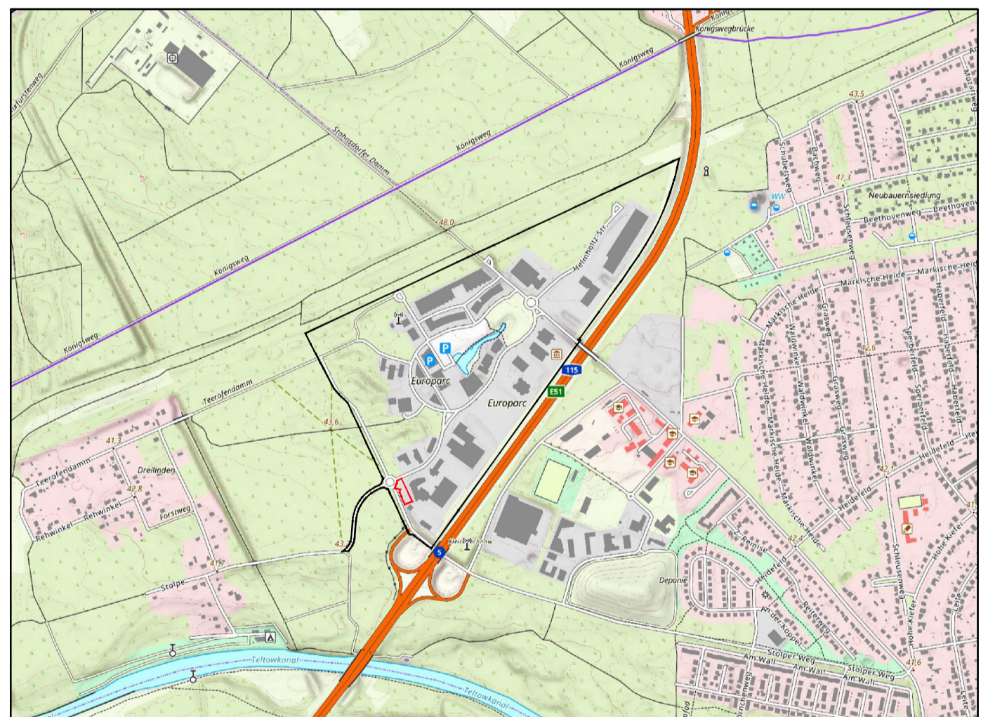
Übersichtslageplan, o.M.

Gemeinde Kleinmachnow Landkreis Potsdam-Mittelmark