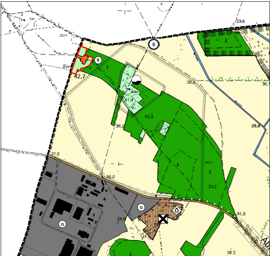
Flächennutzungsplan der Gemeinde Kloster Lehnin in der Fassung der Änderung für den Teilbereich "Landschaftspark Rietzer Berg" M 1:15.000 (Entwurf, Stand: 01/2025)