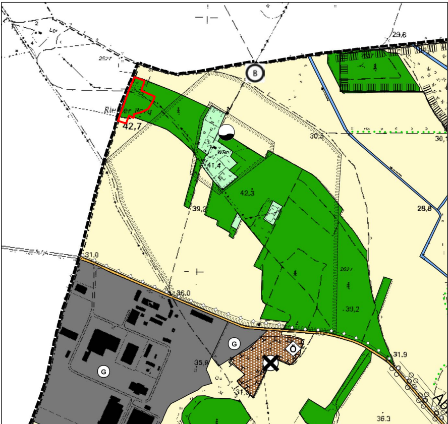
Flächennutzungsplan der Gemeinde Kloster Lehnin, M 1:15.000 (Stand: 27.04.2007)