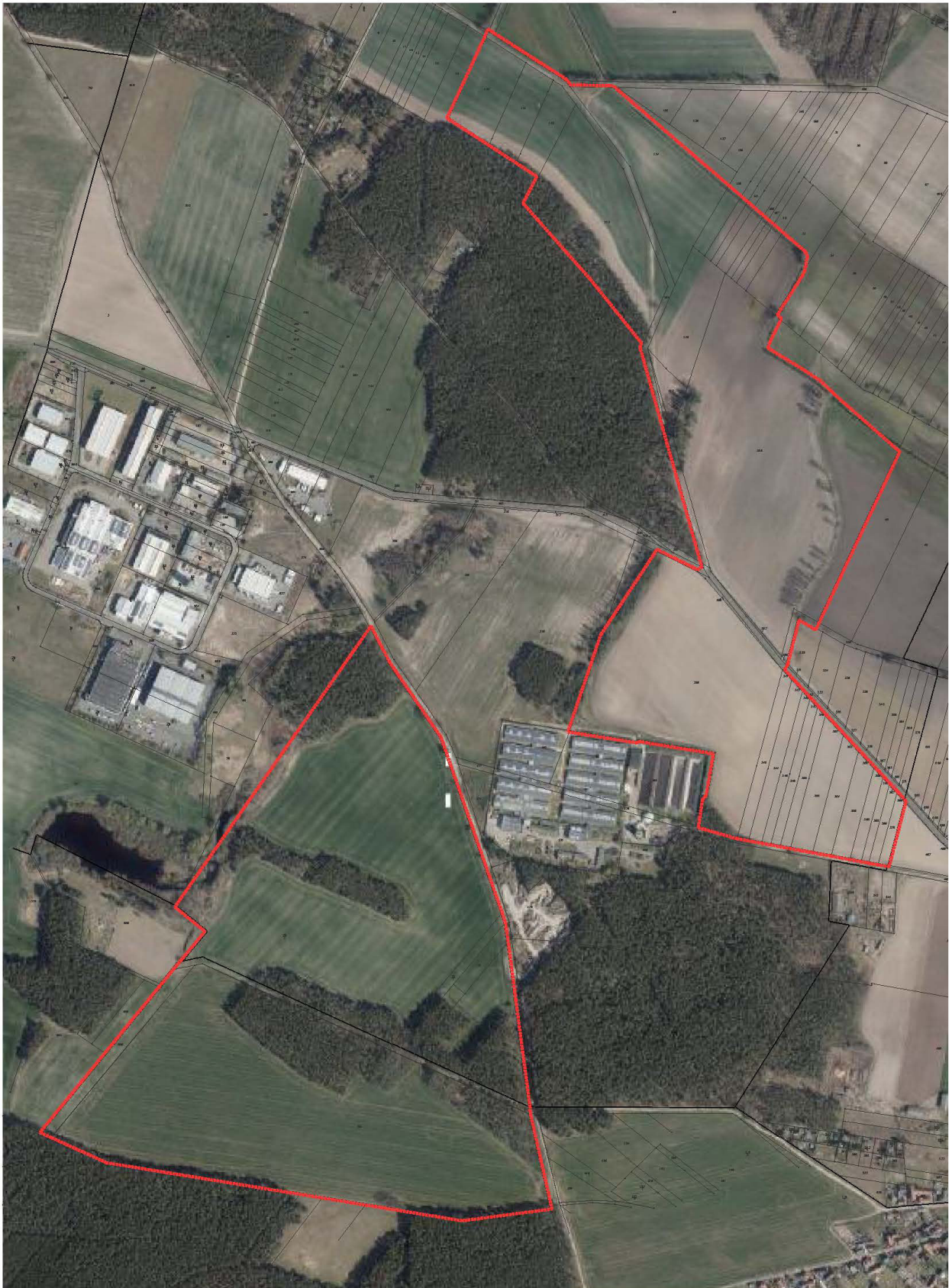
Abb. 1: Vorhabensflächen des geplanten „Sondergebiets Photovoltaik beidseits der Kreisstraße 6949“