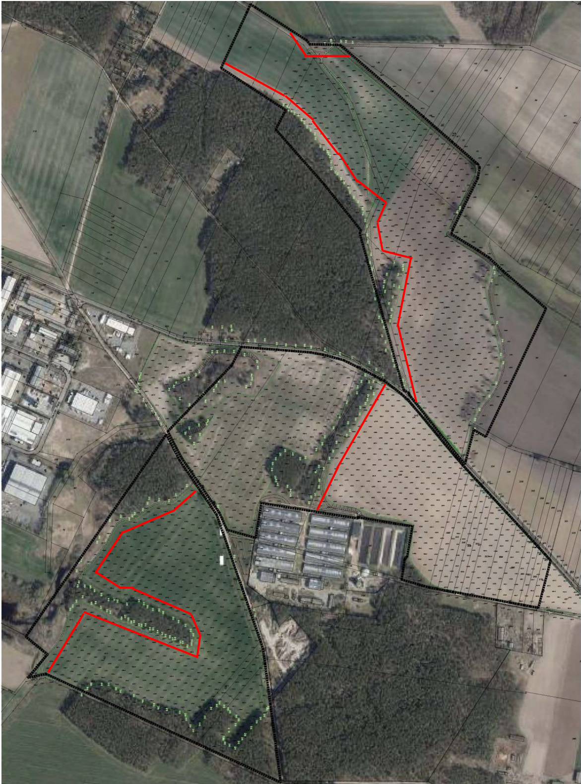
Abb. 5: Maßnahmenfläche für die Heidelerche und den Ortolan in einer Breite von ca. 30 m bis 40 m (rot umrandete Fläche)