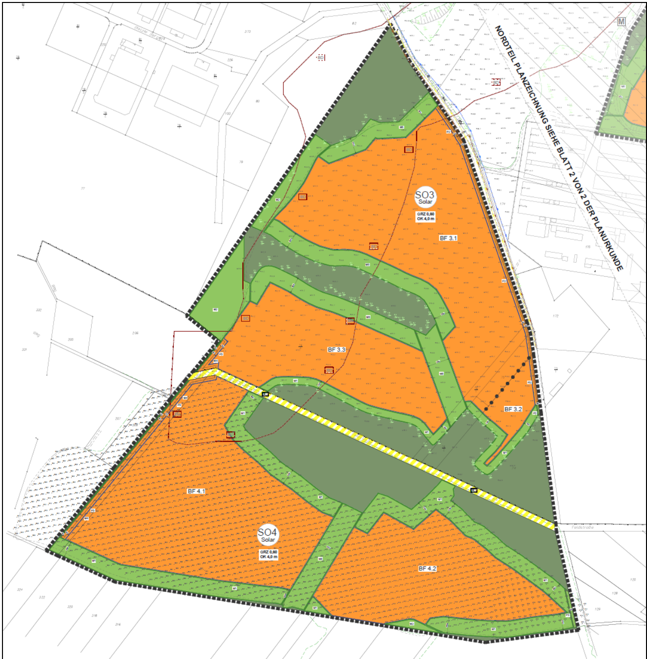
Abb. 4: B-Plan Entwurf zum „Sondergebiet Photovoltaik beidseits der Kreisstraße 6949“ – südliche Teilgebiete III und IV. Stand: Februar 2026