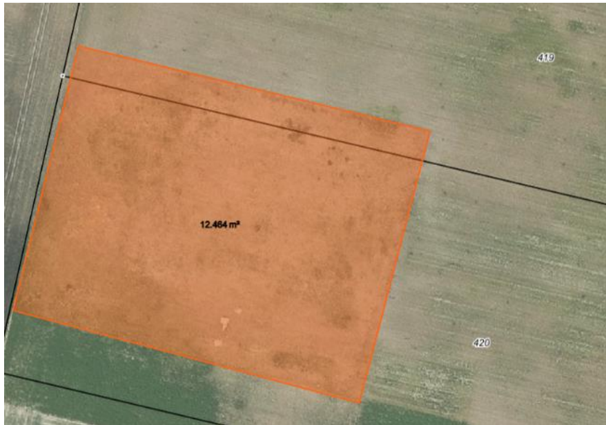
Abbildung 5 Betroffene Fläche in der Draufsicht (eigene Darstellung, Landkreis OPR)