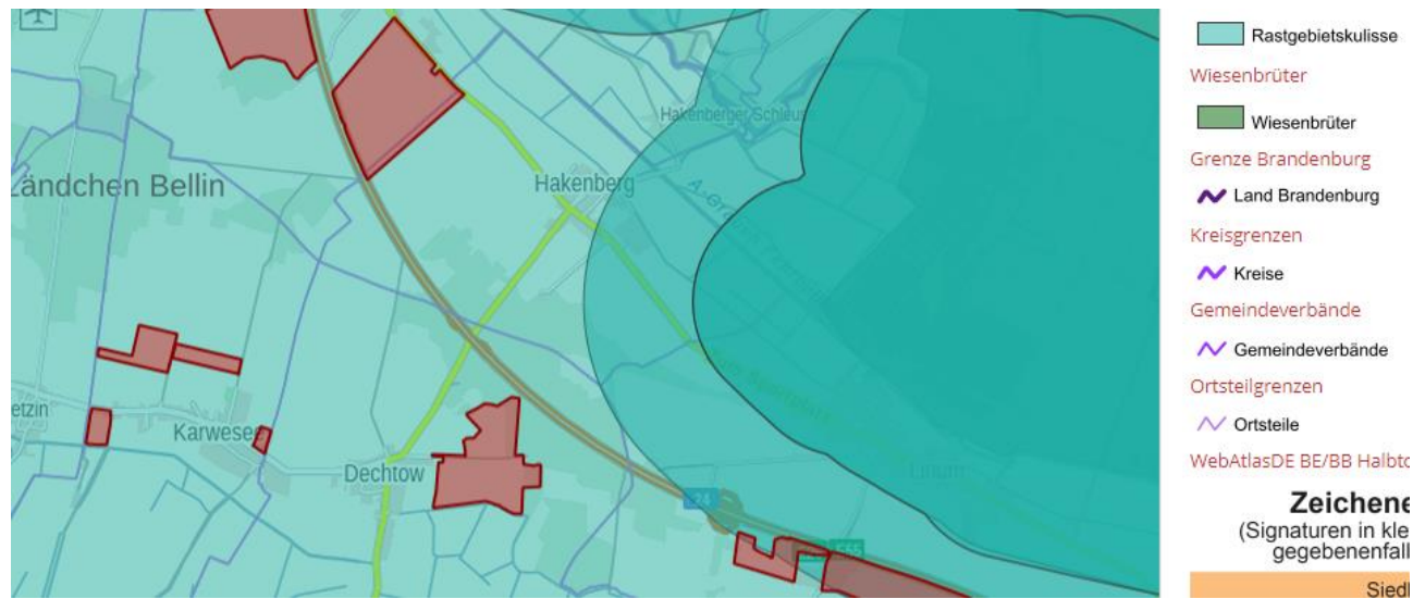
Abbildung 3 Rastgebietskulisse des AGW-Erlasses (eigene Darstellung, Landkreis OPR)