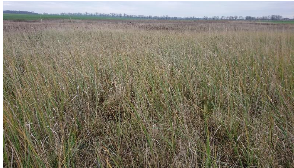
Abbildung 6 Betroffene Fläche im Feld (eigene Darstellung, Landkreis OPR)