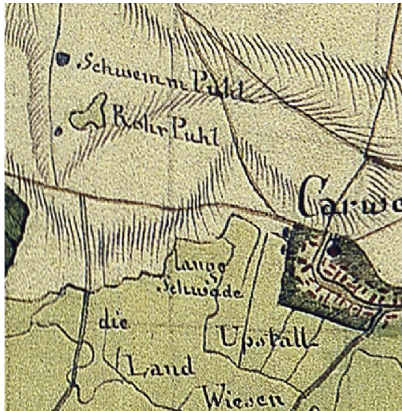
Abbildung 1 Drainageplan AIV Fehrbellin