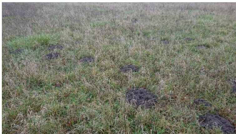
Abbildung 4 Maulwurfshügel in P2 (eigene Darstellung, Landkreis OPR)