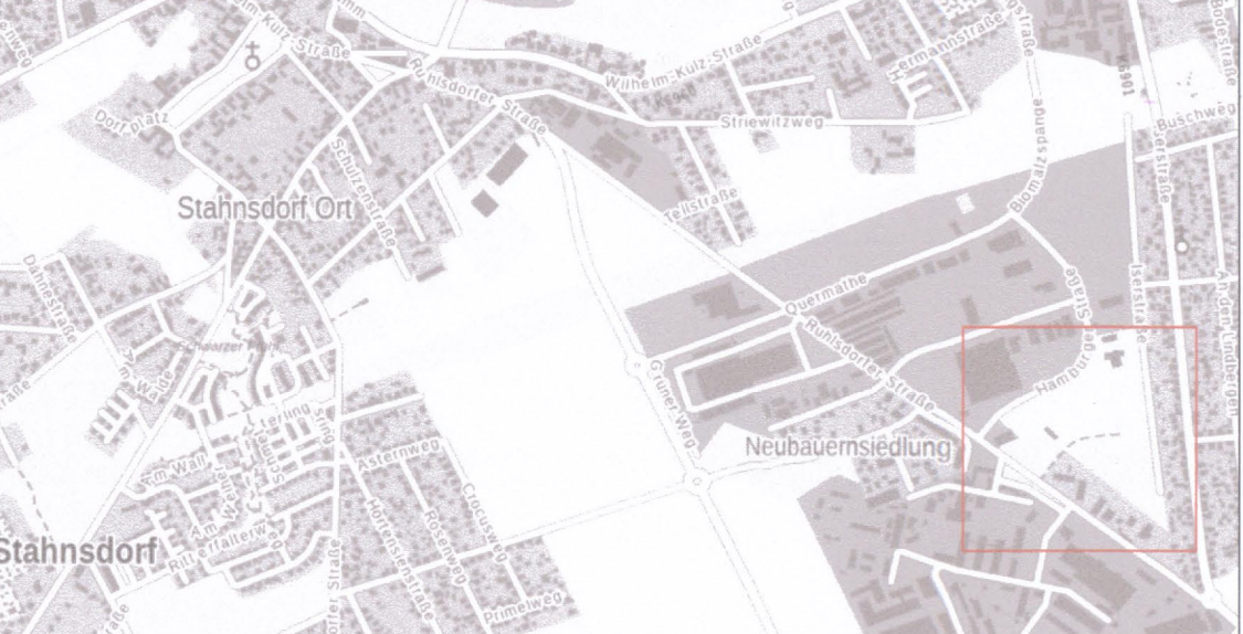
Lage des Planungsgebietes (ohne Maßstab)

1. Änderung des Bebauungsplans Nr. 1a „Hamburger Ring“