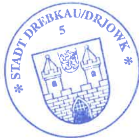
Paul Köhne Bürgermeister