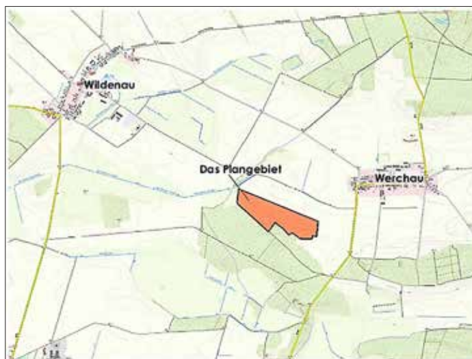
Abbildung 1: Geltungsbereich vhb. B-Plan „Werchau-West“, o. M.

bzw. nach telefonischer Terminvereinbarung eingesehen werden.